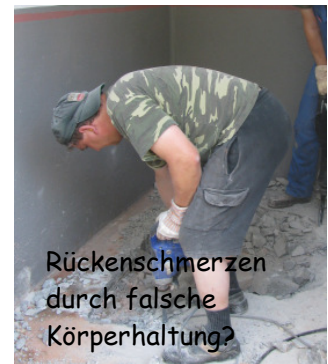
Rückenschmerzen durch falsche Körperhaltung?

Viele Vereinsmitglieder haben Schwierigkeiten mit Bandscheibe, Hüfte, Halswirbel oder Muskulatur. Speziell die Leistungsschützen spüren schnell die Auswirkungen von vielen Trainingseinheiten. Aber auch mancher erfahrene Schütze könnte eine körpertechnische Auffrischung vertragen. Deshalb starten wir gemeinsam mit der Physiotherapie Hobelsberger die Aktion „Kreuz und Gwehr“. Dem Kiniblattl liegt deswegen diesmal ein Flyer bei auf dem Ihr Euch über die Aktion informieren könnt.