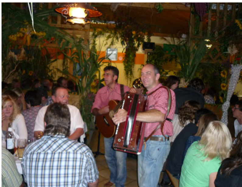
Die Hirschegg Buam waren ein voller Erfolg

Die Geschmäcker sind verschieden. Und das jedes Jahr. Beim Weinfest im letzten Jahr haben wir hauptsächlich halbtrockene Weine verkauft, dieses Jahr wollten die meisten einen trockenen Wein. Mit neun verschiedenen Sorten Wein vom Annenhof und der Kremser Sandgrube konnten aber auf alle Fälle alle Wünsche befriedigt und jeder Durst gestillt werden. 95 Flaschen Wein haben wir am 26. September in unserer „Weinlaube“ vernichtet. Dazu noch 10 Kasten Bier, 8 Kasten Wasser und 9 Kasten andere alkoholfreie Getränke. Gemeinsam mit dem Essen haben wir einen Umsatz von ziemlich genau 2.800 EUR gemacht. Dafür haben von Freitag Abend bis Sonntag Mittag knapp 30 Leute organisiert, gekauft, gefahren, geholt, Tische aufgestellt, dekoriert, repariert, ausgeschenkt, ausgetragen, bedient, gekocht, geschwitzt, geputzt und aufgeräumt. Einen großen Dank an alle die geholfen haben und besonders auch an alle die uns mit Schmanckerln versorgt haben!