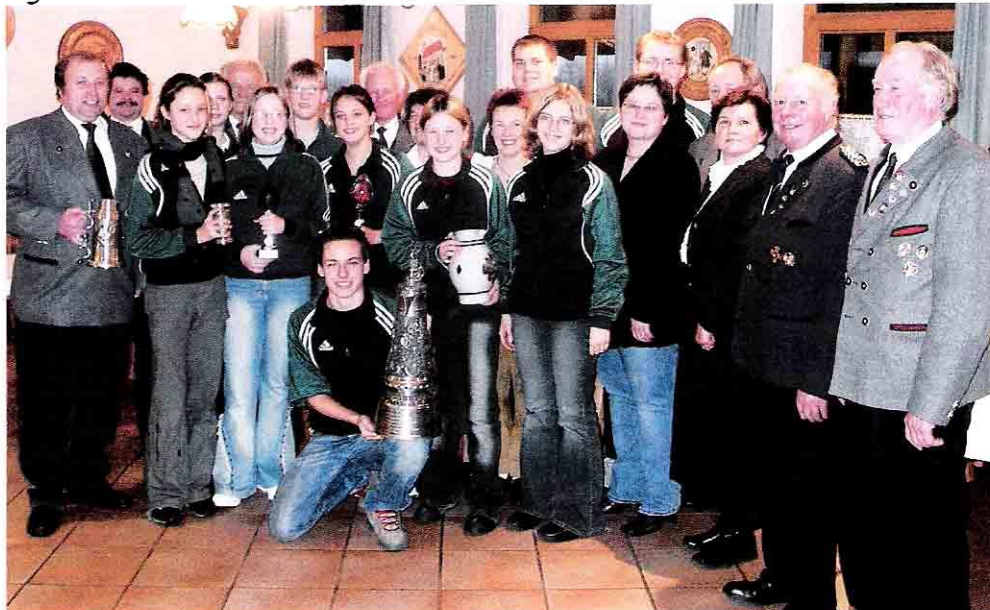
Die Voglarner Delegation nach der Siegerehrung im Schützenhaus Buch

In der Sitzung im Januar hat der Vereinsausschuss auch die Ziele der Bergschützen für das laufende Jahr festgelegt: